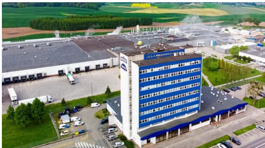
Fot.: Agryf Szczecin / fot. Animex / materiały do pobrania

Niewykluczone, że w niedalekiej przyszłości organizacja zakładowa będzie potrzebowała naszego wsparcia!